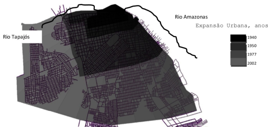
Figura 2- Mapa da Expansão Urbana de Santarém de 1940 a 2002

Todo o processo foi vivenciado em diferentes ciclos de planejamento, saindo da beira rio e adentrando a cidade em direção ao interior, que se mostra em períodos retratados na Figura 3, no primeiro momento até 1940, segundo momento de 1941-1950, terceiro momento de 1951-1977 e por último de 1978-2002, ampliando o traçado inicial das vias de circulação e a forma de utilização do solo com um processo de ocupação desordenado e desenfreado e não acompanhado, em um primeiro momento, pelo poder municipal.