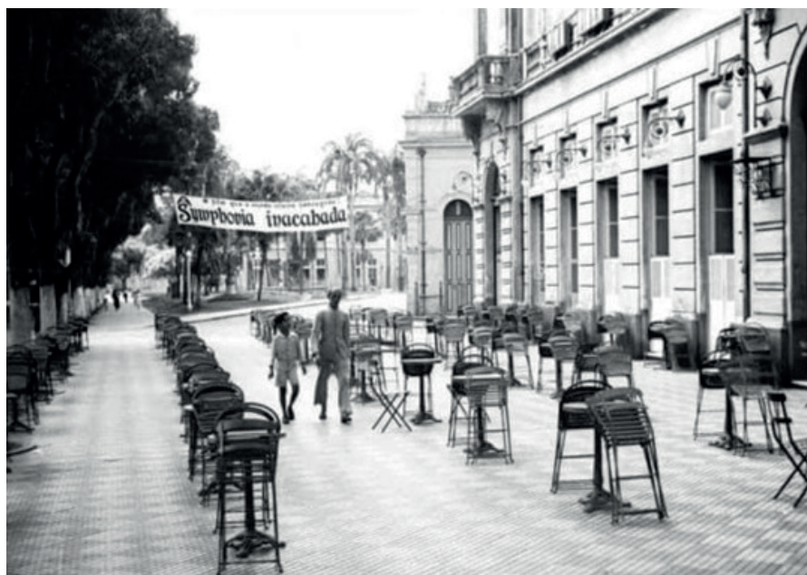
Figura 9 – Terraço do Grande Hotel.