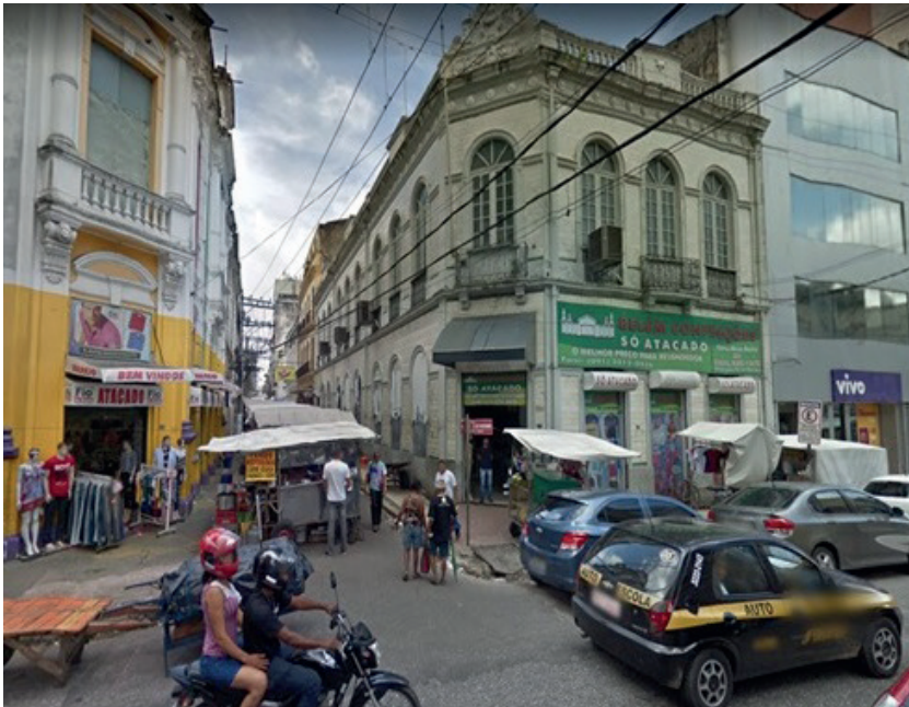
Figura 6 - Espaço atual onde se localizava o Bar Barbinha. Esquina da rua 15 de Novembro com a Campos Sales, (lado direito) onde hoje está a loja Belém Confeções. Imagem do Google Maps disponível em: < https://www.google.com.br/maps/@-1.451573,-48.5015386,3a,75y,145.2h,93.82t/data=!3m6!1e1!3m4!1sOR-9NbHp1FQDLZ1xpyLd-SA!2e0!7i13312!8i6656 >. Acesso em: 20 jan. 2018.