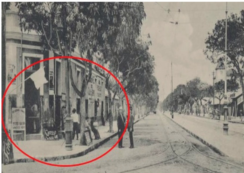
Figura 8 - Localização do complexo de bares da rua Independência. A imagem reporta à rua Independência (atual Magalhães Barata), esquina com a José Bonifácio, no bairro de São Brás, em Belém do Pará. Pela Independência, os bares Pilsen e Paraense; pela José Bonifácio, o Bar Kean, em destaque na figura. Disponível em: < http://fragmentosdebelem.tumblr.com/post/41698916860 >. Acesso em: 20 jan. 2018.