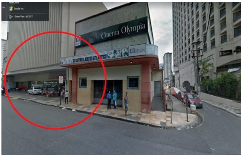
Figura 7 - Espaço atual onde se localizava o City Club. Imagem capturada do Google Maps, disponível em: < https://www.google.com.br/maps/@-1.4537004 >. Acesso em: 12 jan. 2018.