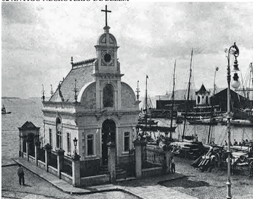
Figura 3 - Necrotério de Belém (1899). Imagem publicada originalmente no Álbum de Belém (1902). Disponível em: < https://pt-br.facebook.com/belemdopassado/photos/a.1430888687132334.1073741828.1430786403809229/1452102025011000 >. Acesso em: 12 jan. 2018.