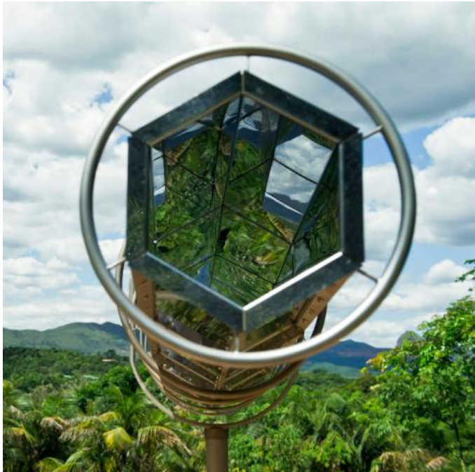
Figura 4 – Olafur Eliasson, Viewing Machine , 2001.