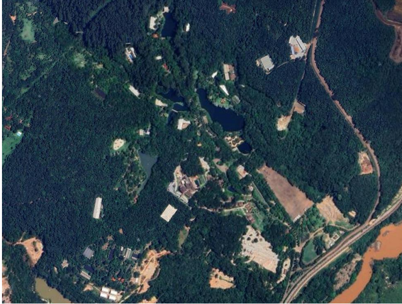
Figura 1 - Instituto Inhotim: vista aérea.