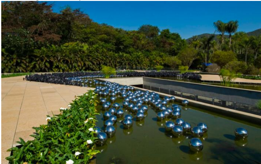
Figura 3 – Yayoi Kusama, Narcissus Garden , 1966/2006.

imagem, da identidade e do próprio sujeito no mundo contemporâneo (Pereira, 2021).