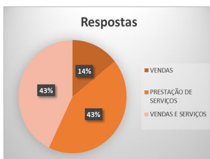
Gráfico 4 – Distribuição de modalidades.

Pergunta 10: Qual a modalidade do seu MEI?